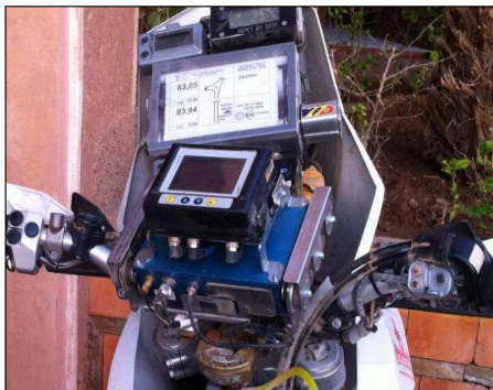
Montage avec support Touratech 6-points pour l'Irtrack et support Omega pour le GPS