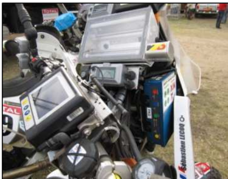
Montage avec support solo Irtrack en séparé sur la colonne de navigation

• Le support doit être fixé devant le pilote et les boutons de l'Irtrack doivent être visibles et accessibles par le pilote pour appui en cas d'urgence.