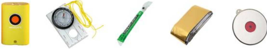
Lampe à éclats – Boussole – Cyalume – Couverture de survie – Miroir de détresse

Vous avez la possibilité d'acheter les équipements de sécurité et de louer un téléphone satellite sur l'e-shop MARLINK EVENTS.